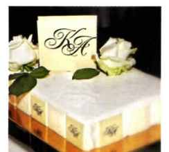
KONZEPT: HOCHZEITSTRAUM - AGENTUR FÜR HOCHZEITSPLANUNG